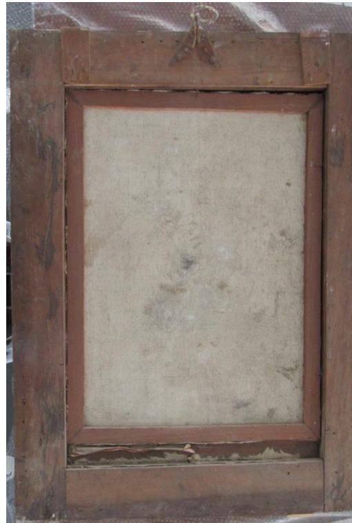
Fotografías No. 1 y 2 . Generales Anverso y reverso de la obra