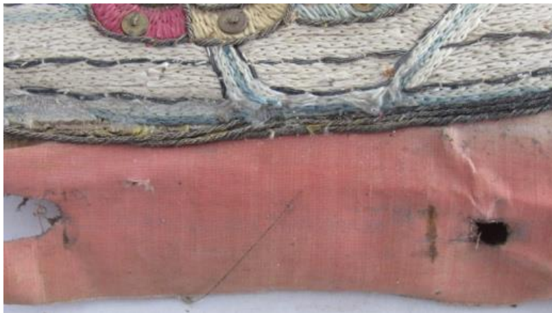
Fotografía N°. 23. Detalle de clavos en el bastidor.

La Virgen se encontraba montada sobre un bastidor que no tenía chaflan y estaba unida a él por medio de clavos, muchos de los cuales estaban oxidados y su cabeza se rompía con la presión de la herramienta con la que eran retirados.