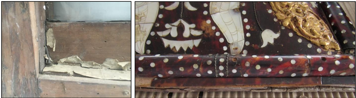
Fotografías No. 13 y 14. Izquierda, detalles de la suciedad del interior del marco. A la derecha, separación de la madera del marco, faltantes de carey y de nácar.