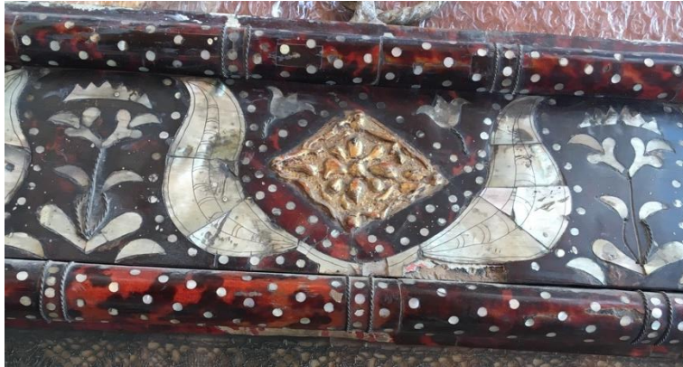
Fotografías No. 11 y 12. Detalles de la suciedad listón superior y faltantes de carey