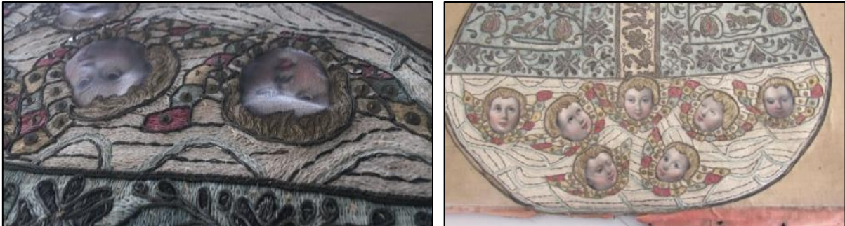
Fotografías No. 5 y 6. Izquierda, deformación del plano del óleo sobre tela, derecha, decoloración del soporte, parte inferior del bordado que se encuentra debajo del marco.