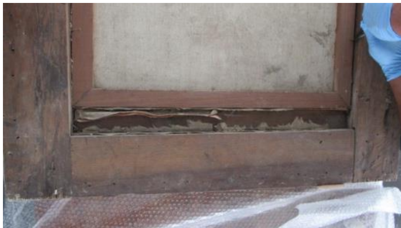
Fotografías No. 15 y 16. Espacio entre el bastidor y el marco