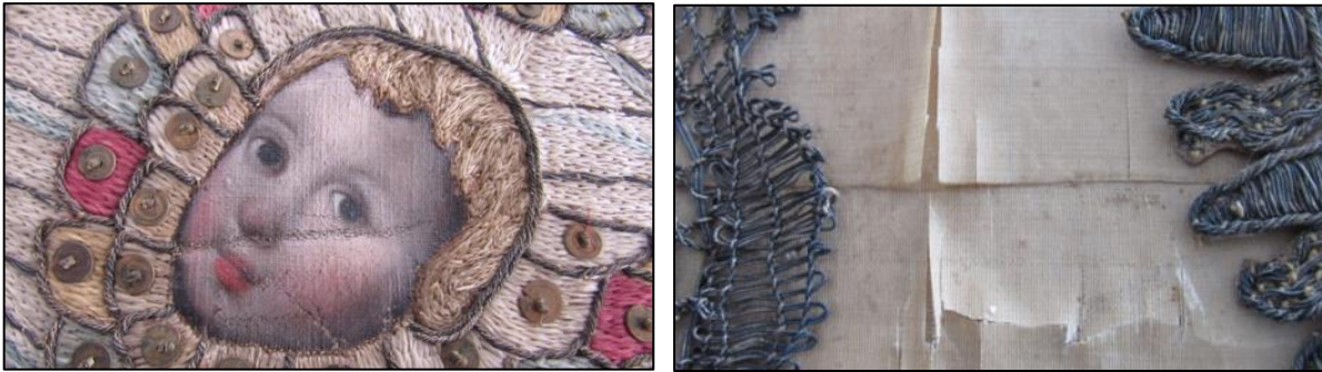
Fotografías No. 3 y 4. Izquierda, detalles de rayones sobre la pintura sobre tela y a la derecha rasgaduras producidas por la friabilidad de las fibras y suciedad sobre los hilos metálicos.

La obra se encuentra totalmente adherida a un lienzo por medio de un adhesivo, lo que le causó una friabilidad generalizada a las fibras, el bordado se retiró y se cosió y pegó a este nuevo soporte, cambio de formato dejando una tela restante en la parte inferior. El soporte de seda se encuentra totalmente decolorado lo que se evidencia en el excedente de tela en la parte inferior y debajo de los bordados. Suciedad generalizada en toda la obra y suciedad concentrada en los bordes y en el reverso debajo del bastidor, así como manchas de humedad que se observan en la parte inferior. Los bordes están desflecados. Sobre las caras pintadas al óleo, se observan rayones, pequeños faltantes, suciedad superficial y deformación del plano.