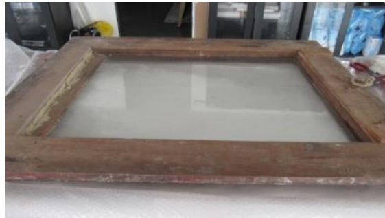
Fotografías N°. 20, 21 y 22. Desmante obra del marco