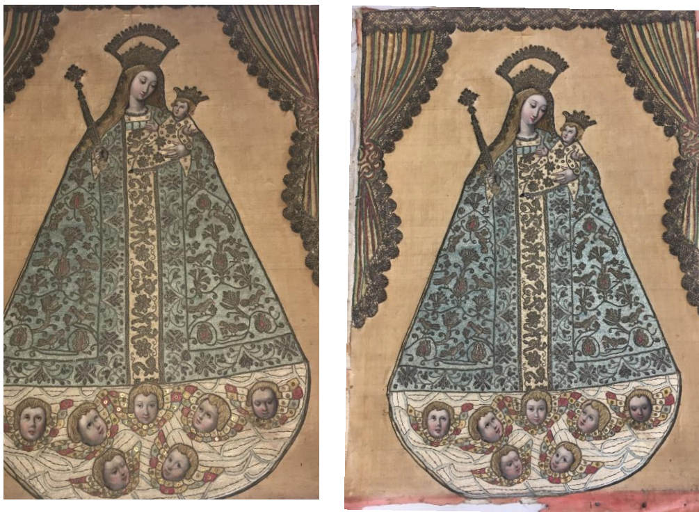
Fotografías N°. 24 y 25. General de la obra sin aspirar y después del proceso de aspirado

Se realizaron pruebas de limpieza para verificar el nivel al que se podría llegar con los hilos metálicos al iniciar el proceso de restauración.