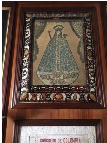
Fotografías No. 17. Obra en la pared del Aula Máxima

La obra se encuentra colgada en la pared occidental de Aula máxima de la Universidad del Rosario. Para retirarla fue necesario quitar un sobre marco que la sostiene dentro de un enchape en madera de la pared. El marco se encuentra colgado a la pared por medio de un aro metálico. Cuando se monte nuevamente va a haber un cambio ya que se retirara el sobremarco para dejar ver todo el marco.