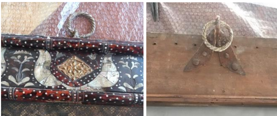
Fotografías No. 18 y 19. Sistema actual de montaje de la obra, derecho y revés.