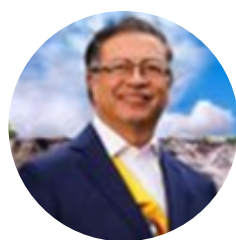
Gustavo Petro @petrogustavo

La normalización de los pasos fronterizos entre el departamento de Norte de Santander y el estado de Táchira tendrá una gran incidencia en las dinámicas de la movilidad humana entre Colombia y Venezuela. El tema no ha sido incluido en la agenda de prioridades de los gobiernos, a pesar de ser éste un asunto que afecta la vida de millones de colombianos y venezolanos que conviven en la frontera o que han elegido emprender una vida en el otro país.