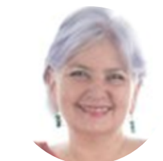
Gloria Flórez @GloriaFlorezSI

“Que la democracia, la Paz, y el respeto absoluto a la dignidad del ser humano sean nuestra consigna común”- Presidente @petrogustavo en la reapertura de la frontera. ¡Le cumplimos a Norte de Santander! Se reabrió la frontera y con esto garantizaremos el bienestar general.