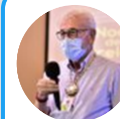
Jairo Yáñez @ingjairoyanez

Los primeros vehículos de carga de Colombia hacia Venezuela, pasarán con insumos médicos, cajas de cartón corrugado, elementos de aseo, confitería, platos y vasos plásticos.