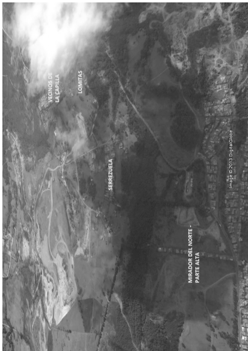
Mapa 4. Barrios asentados en la parte alta

Tomado de: https://maps.google.ca . 2013.