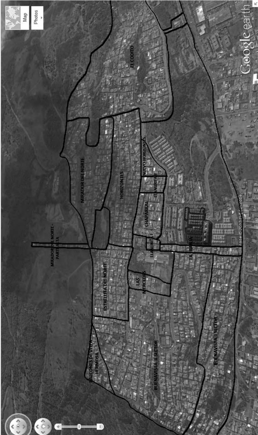
Mapa 3. Barrios y divisiones territoriales